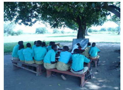
教室が足りないため外で授業を受ける現状