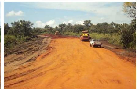
右上 Dawa橋付近 道路改良工事 土のラテライト色が印象的です