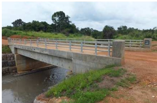
6月に完成した Ayago橋 国内避難民帰還の促進、帰還後の生活向上に寄与することが期待されます。

アムル県、ヌウオヤ県、グル県、ラムウオ県、アガゴ県の5県6か所に6つの橋梁+アプローチ道路(Atiabar橋、Ayago橋、Chome橋、Dawa橋、Arainga橋、Otaka橋)、1か所の簡易アスファルト舗装道路(11Km)、他カルバートの建設を実施します。2012年8月の完工予定でしたが、一部セクションは完成したものの全体として遅延気味であり、現時点では2012年12月頃完工の見込みです。