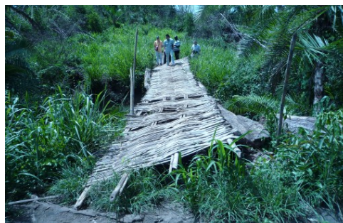
学校や病院へのアクセスが困難