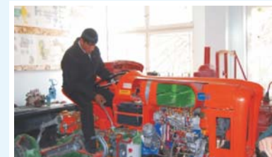
Среднее специальное образование (Кредит 2001 г. 70 млн. долларов США)