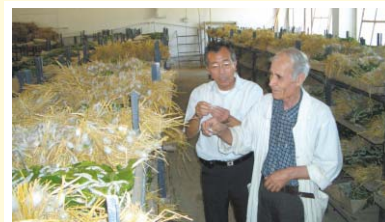
Дальнейшее развитие шелководства на Шелковом пути в Узбекистане - разработка модели по получению доходов в сельской местности через усовершенствование шелководства в Ферганской долине (ППЖ 2009 - 2012 гг.)