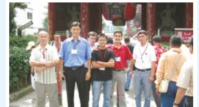
Предоставление стипендий для подготовки кадров (JDS) по программе безвозмездной помощи Правительства Японии (ГП 2000 г. ~ 28.5 млн. долларов США, 191 выпускников на май 2010 г.)