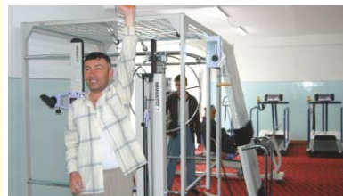
Модернизация оборудования для национального центра реабилитации и протезирования инвалидов (ПТС 2009 - 2010 гг.)