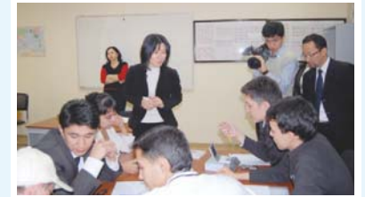
Направление Японских волонтеров по международному сотрудничеству (ПТС ~ май 2010 г., количество направленных 106)