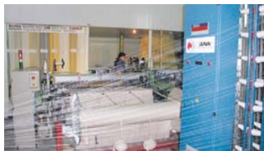
Модернизация оборудования Ташкентского Текстильного Института Лёгкой Промышленности (ГП 2000 г. 4.9 млн. долларов США)