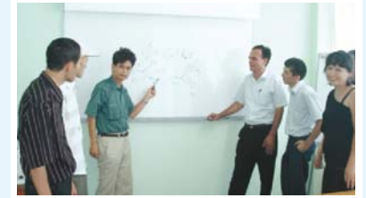
Направление старших волонтеров (ПТС ~ май 2010 г., количество направленных 43)