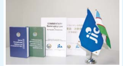
Подготовка комментариев к Закону РУз «О банкротстве» (ПТС 2005 - 2007 гг.)