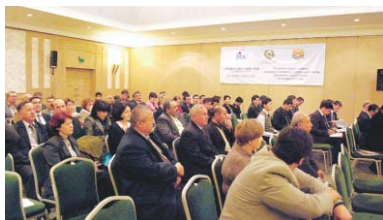
Совершенствование налогового администрирования (ПТС 2008 - 2011 гг.)