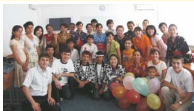
Бухарский филиал Узбекского - Японского Центра Развития Людских Ресурсов (ПТС 2008 - 2010 гг.)