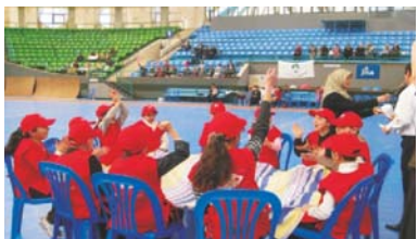
Социальная реабилитация людей с ограниченными возможностями среди населения г. Ташкента (ПТС 2008 - 2010 гг.)