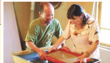
Восстановление самаркандской бумаги и дальнейшее развитие ручного ремесла для улучшения условий жизни в поселке Кони Гил в Самаркандской области (ППЖ 2010 - 2012 гг.)