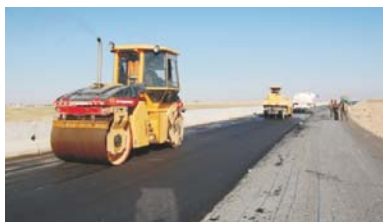
Поставка оборудования для строительства и технического обслуживания дорог (ГП 1997 г. 10.7 млн. долларов США, 2005 г. 10.8 млн. долларов США)