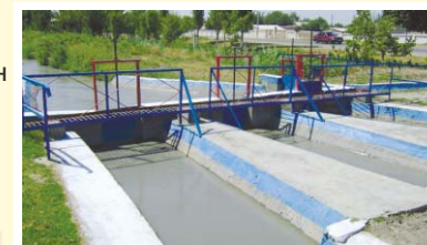
Улучшение управления водными ресурсами (ПТС 2009 - 2013 гг.)