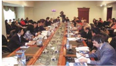
Правовая помощь по улучшению условий для развития частного предпринимательства (ПТС 2005 - 2008 гг.)