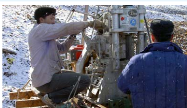
Развитие потенциала по мониторингу оползней (ПТС 2007 - 2010 гг.)