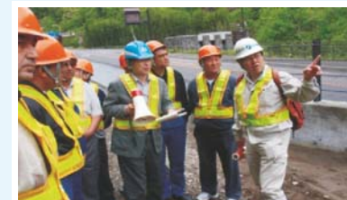
Программа обучения и диалога JICA (ПТС ~ май 2010 г., количество участников 1471)