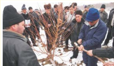
Улучшение технологии по выращиванию фруктов в Ферганской долине, Фаза 2 (ППЖ 2008 - 2011 гг.)