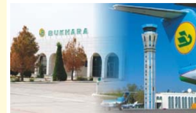
Модернизация трёх местных аэропортов в городах: Самарканд, Ургенч и Бухара (1)(2) (Кредит 1996 г. 172.5 млн. долларов США, 1999 г. 31.9 млн. долларов США)