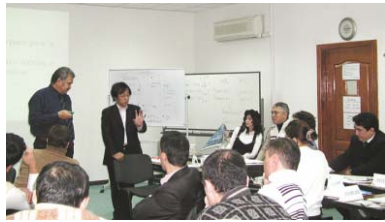
Узбекско - Японский Центр Развития Людских Ресурсов (ПТС 2000 - 2010 гг.)