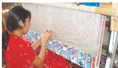
Исследование регионального развития в Республике Каракалпакстан (ПТС 2008 - 2011 гг.)