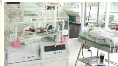
Модернизация оборудования научно-исследовательского института акушерства и гинекологии (ГП 2007 г. 4.1 млн. долларов США)