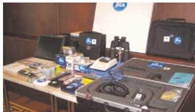
Управление границами в Узбекистане, Киргизской Республике и Таджикистане (ПТС 2007 г. 0.2 млн. долларов США)