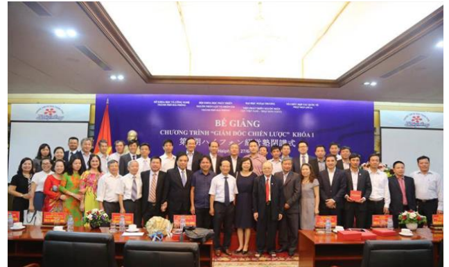
Hình ảnh tại lễ bế giảng Keieijuku khóa 1 tại Hải Phòng ngày 27/06/2017

Phát biểu tại lễ bế giảng, ông Nguyễn Xuân Bình, Phó Chủ tịch thường trực UBND thành phố Hải Phòng chúc mừng 25 doanh nhân học viên đã tốt nghiệp khóa học Keieijuku khóa 1 Hải Phòng và bày tỏ mong muốn các doanh nhân sẽ mang những kiến thức học được từ các chuyên gia Nhật Bản về áp dụng điều hành doanh nghiệp mà mình đang quản trị, góp phần phát triển doanh nghiệp đóng góp vào sự phát triển chung của thành phố Hải Phòng nói riêng và đất nước nói chung.