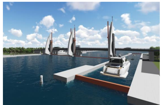
Phối cảnh một công ngăn mặn thuộc dự án

Để khắc phục tình trạng này và mở rộng tiềm năng thu hút đầu tư cho nông nghiệp, giải pháp ngăn mặn triệt để như xây dựng các công ngăn mặn và lắp đặt hệ thống quản lý nồng độ mặn là vô cùng cần thiết để mang lại lợi ích cho người dân, nông dân, nhà đầu tư và nền kinh tế tỉnh Bến Tre.