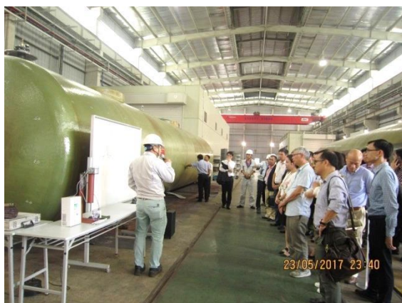
Buổi tham quan xưởng chế tạo thùng chứa 2 lớp do công ty Tamada và Idemitsu tổ chức