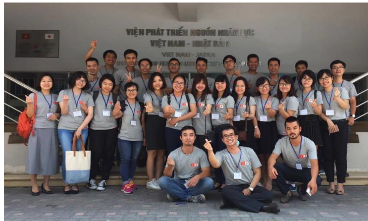
Nhóm học viên JDS Năm thứ 17 trong thời gian tập huấn trước ngày lên đường tới Nhật Bản

Ngày 28/7/2017, trong khuôn khổ hợp tác giữa Bộ Giáo dục và Đào tạo Việt Nam, Cơ quan Hợp tác Quốc tế Nhật Bản (JICA) và Đại sứ quán Nhật Bản tại Việt Nam, Chương trình học bổng Phát triển Nguồn Nhân lực cho Việt Nam (JDS) 2017, sử dụng nguồn vốn viện trợ không hoàn lại của Chính phủ Nhật Bản, đã chính thức được khởi động.