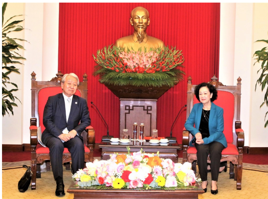
Chủ tịch JICA - ông TANAKA Akihiko hội đàm với Thường trực Ban Bí thư, Trưởng ban Tổ chức Trung ương Đảng Trương Thị Mai