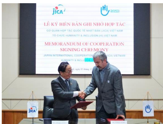
Đại diện JICA và HI ký kết Biên bản ghi nhớ

Tại văn phòng UBND tỉnh Thừa Thiên Huế ngày 5/12/2019, Cơ quan Hợp tác Quốc tế Nhật Bản (JICA) và tổ chức phi chính phủ Humanity & Inclusion (HI) đã ký Thỏa thuận Hợp tác về việc cử tình nguyện viên quốc tế làm việc tại các bệnh viện đối tác ở hai tỉnh Thừa Thiên Huế và Quảng Trị, nhân kỷ niệm Ngày Tình nguyện viên Quốc tế (5/12).