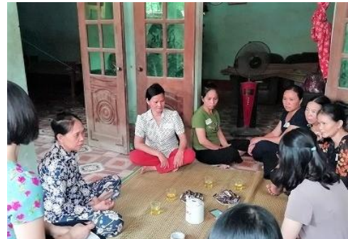
Thảo luận nhóm tập trung tại một huyện ở Thanh Hóa

https://www.jica.go.jp/project/vietnam/053/outline/index.html