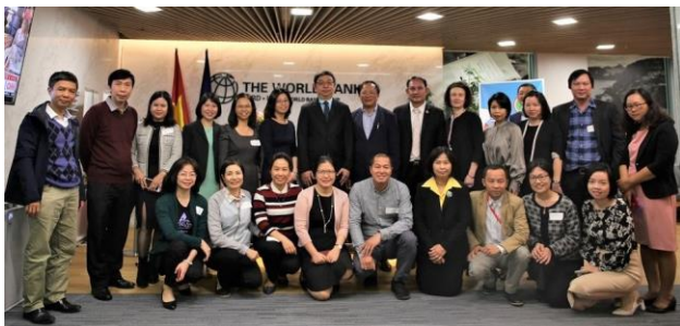
Các đại biểu chụp ảnh kỉ niệm sau Hội thảo

Ngày 18/12, Cơ quan Hợp tác Quốc tế Nhật Bản (JICA) và Ngân hàng Thế giới (WB) đã đồng tổ chức Hội thảo chia sẻ kinh nghiệm về già hóa dân số.