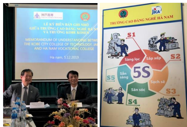
Ảnh trái: Lễ ký kết biên bản ghi nhớ Ảnh phải: Bảng 5S tại trường Cao đẳng nghề Hà Nam

https://www.jica.go.jp/vietnam/vietnamese/activities/partnership.html