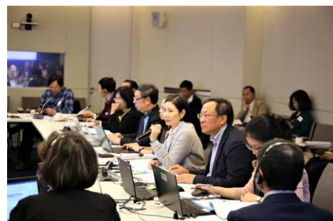
Tham dự Hội thảo có khoảng 30 đại biểu đến từ các Bộ, Viện nghiên cứu và các Tổ chức liên quan

Trong bối cảnh già hóa dân số ở Việt Nam đang diễn ra nhanh chóng, việc xây dựng và triển khai những chính sách phù hợp để thích ứng với già hóa dân số là vô cùng cần thiết.