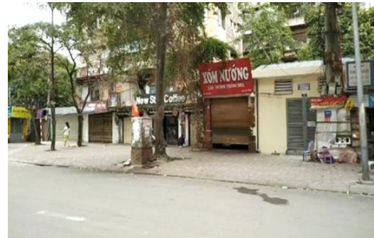
Các cửa hàng kinh doanh tại Hà Nội đóng cửa trong thời gian “giãn cách xã hội”