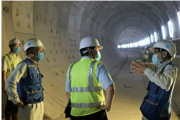
Trưởng đại diện Văn phòng JICA Việt Nam (áo vàng, ở giữa) thị sát công trường Dự án đường sắt đô thị tuyến số 1 Tp. Hồ Chí Minh