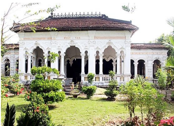
Nhà cổ ông Xoát – Ngôi nhà cổ lâu đời nhất mang dáng vẻ của kiến trúc phương Tây ở làng cổ Đông Hòa Hiệp

Chương trình Đối tác Phát triển của JICA được bắt đầu triển khai từ năm 2002 và cũng là một trong những chương trình đầy mới mẻ trong các hoạt động của JICA.