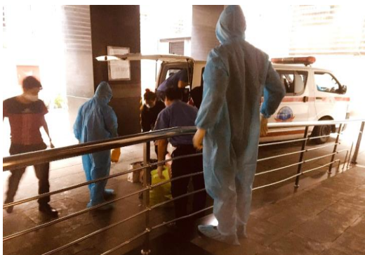
Cô họ của tác giả bài viết được đưa lên xe cấp cứu đến nơi cách ly tập trung

Sinh hoạt ở nơi cách ly nghe có vẻ cũng ổn, các bữa ăn được cung cấp đầy đủ, và rồi quãng thời gian cách ly cuối cùng cũng kết thúc ổn thỏa (hay đúng hơn là tôi nghĩ vậy!).