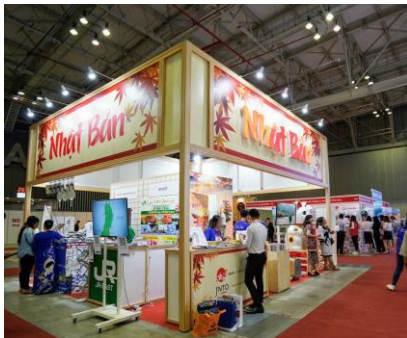
Gian hàng của JNTO tại Hội chợ Du lịch Quốc tế để xúc tiến du lịch Nhật Bản

Nhưng không ai dự đoán trước được tương lai của mình, khoảng 10 năm sau – vào năm 2012, Chính phủ Nhật Bản quyết định công nhận Việt Nam là một trong những thị trường quan trọng để phát triển ngành du lịch inbound của Nhật Bản. Tôi được cử sang Thái Lan làm việc và bắt đầu dự án về thị trường Việt Nam. Sau khi kết thúc nhiệm kỳ ở Thái Lan, “Duyên” giữa Việt Nam và tôi vẫn chưa hết, JNTO đã chọn tôi làm trưởng đại diện “Đầu tiên” của văn phòng mới tại Việt Nam. Đây là sự kết hợp hoàn hảo của sự “Đầu tiên” và “Duyên” đối với tôi.