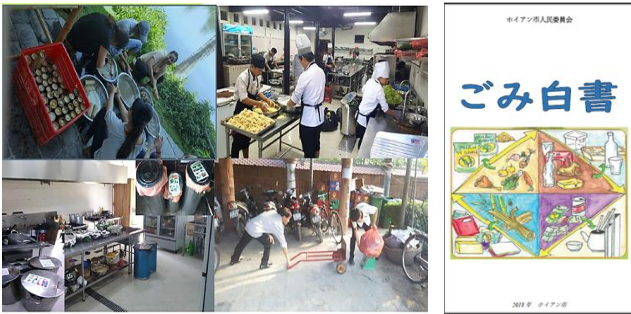
Việc thu gom, phân loại, cần rác thải và các công cụ thực hiện

Rác thải ở Việt Nam đang là một hiện trạng đáng lo ngại. Thành phố Hội An, nơi thu hút nhiều khách du lịch trong nước và quốc tế, cũng gặp nhiều khó khăn trong vấn đề xử lý rác thải. Dự án đã tiến hành cải tiến phương pháp phân loại rác tại hộ gia đình, tái chế phế liệu từ chất thải thực phẩm từ các nhà hàng.