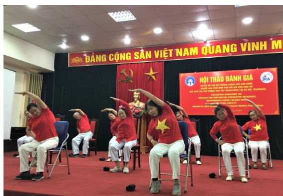
Người cao tuổi biểu diễn bài thể dục tránh ngã

Với mong muốn mang đến cho người cao tuổi một sức khỏe tốt, giảm phụ thuộc vào bệnh viện, ứng phó với vấn đề già hóa dân số tại Việt Nam, Dự án giới thiệu chương trình chăm sóc sức khỏe, hướng dẫn bài tập “thể dục tránh ngã” cho người cao tuổi. Tại các phường thí điểm nằm trong Dự án, người cao tuổi tập trung tại các địa điểm công cộng tập thể dục đều đặn hàng sáng.