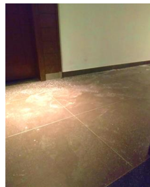
Hành lang phủ một màu trắng xóa chất khử trùng

Ngồi trong nhà mà mùi hóa chất khử trùng, sát khuẩn clo vẫn xộc vào qua khe cửa. Chỉ cần hé cửa ra vào là nhìn thấy hành lang phủ một màu trắng xóa chất khử trùng, mùi hăng nồng bốc lên như mùi trong “bê bơi công cộng”. Vì mùi rất khó chịu nên tôi lấy băng dính dán chặt các khe cửa lại. Cảm giác nao nao giống như mình bị coi như một loại vi khuẩn gây bệnh nào đó, khiến tôi nghĩ về “sự kì thị với bệnh truyền nhiễm (ngghi ngờ lây nhiễm) có lẽ bắt đầu từ cảm giác này”. Tôi nhận thấy rằng ngay cả bây giờ, sự kỳ thị và phân biệt đối xử với HIV/AIDS vẫn còn xảy ra.