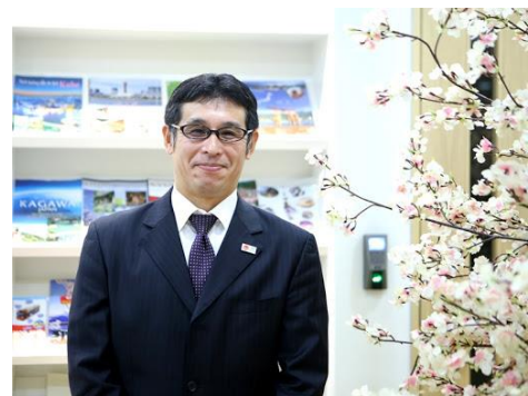
Văn phòng JNTO tại tầng 4 cùng tòa văn phòng với JICA. Xin hãy nhấn Like và theo dõi kênh Facebook của chúng tôi nhé! (@camhannhatban)

Trưởng đại diện Văn phòng JNTO Việt Nam Tình nguyện viên JICA ngành nghề du lịch (năm 2000-03)