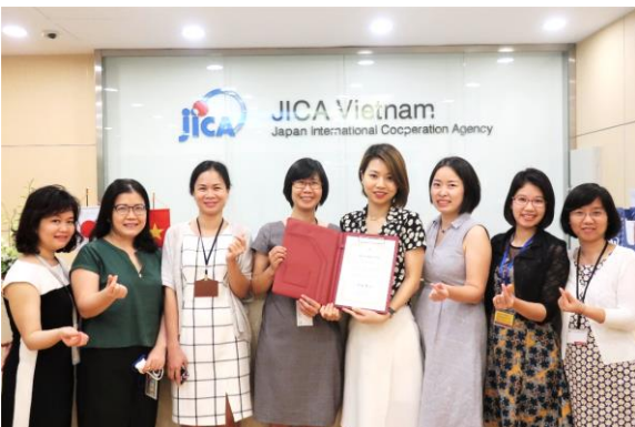
Nhóm đánh giá hậu dự án nội bộ Văn phòng JICA Việt Nam

Đánh giá hậu dự án được thực hiện bởi các văn phòng JICA ở nước ngoài cho những dự án có giá trị từ 200 triệu đến 1 tỷ yên Nhật (khoảng 40-200 tỷ đồng) vào khoảng 3 năm sau khi dự án kết thúc. Trong tài khóa