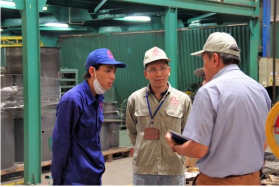
Chuyên gia hướng dẫn trực tiếp tại nhà máy