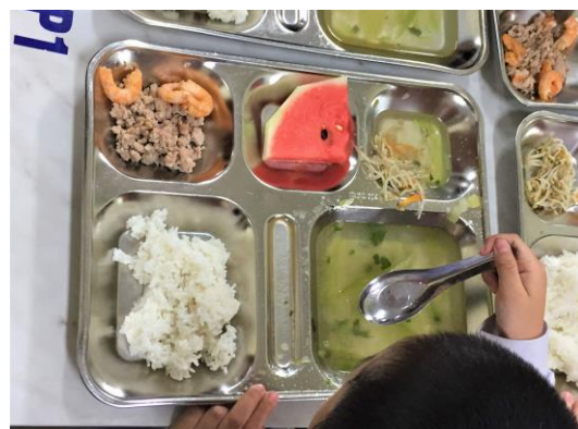
Suất ăn của học sinh được điều chỉnh dinh dưỡng hợp lý