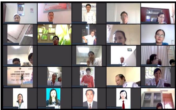
Các đại biểu tham dự hội thảo trực tuyến tích cực đặt câu hỏi và bày tỏ sự quan tâm lớn đối với kết quả dự án

Ngày 7/5, JICA đã tổ chức hội thảo trực tuyến nhằm chia sẻ kinh nghiệm và báo cáo kết quả của Dự án Hợp tác Kỹ thuật “Tăng cường Hệ thống Đào tạo lâm sàng cho Điều dưỡng mới tốt nghiệp tại Việt Nam”. Dự án được thực hiện trong thời gian 4 năm (từ tháng 5/2016 đến tháng 5/2020)* 1 .