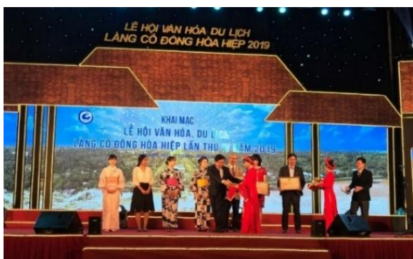
Chủ tịch UBND Tỉnh Tiền Giang trao giải thưởng cho cá nhân, tổ chức có đóng góp trong công cuộc bảo tồn, phát huy giá trị di sản văn hóa làng Đông Hòa Hiệp

Với những thành tựu đáng kể, tháng 11/2019, UBND tỉnh Tiền Giang đã trao giải thưởng cho JICA, trường Đại học Nữ Chiêu Hòa và các cá nhân, tổ chức có đóng góp trong công cuộc bảo tồn, phát huy giá trị di sản văn hóa làng Đông Hòa Hiệp (xem bản tin JICA tháng 12/2019)* 2 .