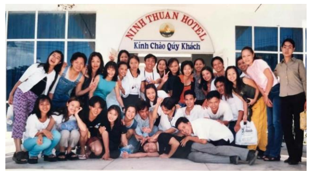
Hình lưu niệm với các bạn sinh viên trong nhiệm kỳ TNV (Thực tập hướng dẫn viên du lịch)

đứng lớp được. Hàng ngày tôi cảm thấy bất lực với hoàn cảnh và đã được cấp trên tạo điều kiện cho phép tôi tham dự kiến giảng lớp của ông ấy dạy cho các bạn sinh viên. Đồng thời, tôi cũng được đồng nghiệp (hiện nay anh ấy là bạn thân nhất của tôi) dạy cho thuật ngữ chuyên ngành du lịch để nâng cao vốn tiếng Việt. Kết quả, sau khoảng một năm tôi đã có thể đứng lớp được. Tôi biết ơn hai người giáo viên tuyệt vời này vô cùng.