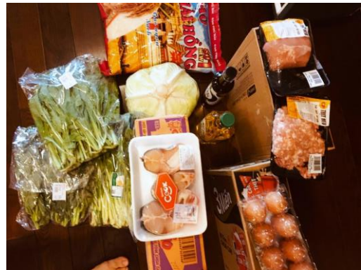
Gia đình tôi (có 5 người) được cung cấp lương thực- thực phẩm như trong hình

Những ngày sau đó, chúng tôi cũng được phát rau xanh thường xuyên. Tôi rất cảm kích trước sự chăm lo chu đáo như vậy. Tuy bị hạn chế đi lại nhưng trước mắt chúng tôi không cần phải lo lắng về vấn đề ăn uống hàng ngày.