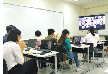
Giao lưu trực tuyến giữa sinh viên Đại học Việt Nhật và sinh viên Đại học Hosei

Tham khảo: Dự án Hợp tác Kỹ thuật Xây dựng chương trình đào tạo Thạc sỹ của Trường Đại học Việt - Nhật (từ tháng 4/2015 - 3/2020): https://www.jica.go.jp/project/vietnam/040/index.html