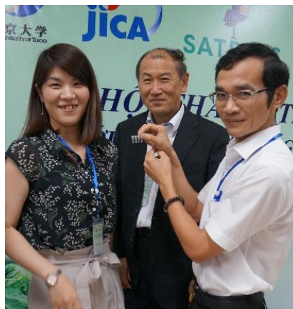
Các nhà nghiên cứu thuộc Đại học Tokyo và Viện Bảo vệ Thực vật Việt Nam phát triển bộ dụng cụ phát hiện virus

*2. SATREPS: Là chương trình có tên chính thức là “Chương trình hợp tác nghiên cứu khoa học và công nghệ nhằm giải quyết các vấn đề mang tính toàn cầu” (Science and Technology Research Partnership for Sustainable Development - SATREPS). Đây là chương trình Hợp tác Kỹ thuật theo hình thức nghiên cứu chung quốc tế được thực hiện với sự hợp tác của JICA và Cơ quan Khoa học và Công nghệ Nhật Bản (JST).