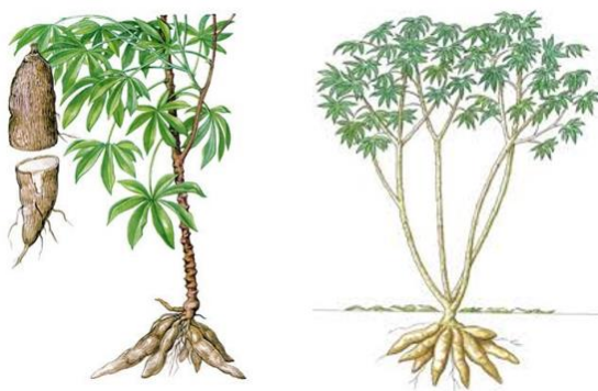
Cây sắn (Tapioca)