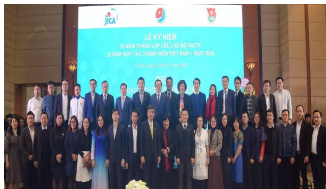
Các đại biểu chụp ảnh kỷ niệm

Buổi lễ đã ôn lại lịch sử phát triển tốt đẹp trong quan hệ hợp tác thanh niên giữa hai nước Việt Nam – Nhật Bản. Các đại biểu đều đánh giá cao ý nghĩa, hiệu quả và các hoạt động góp phần tích cực trong việc làm