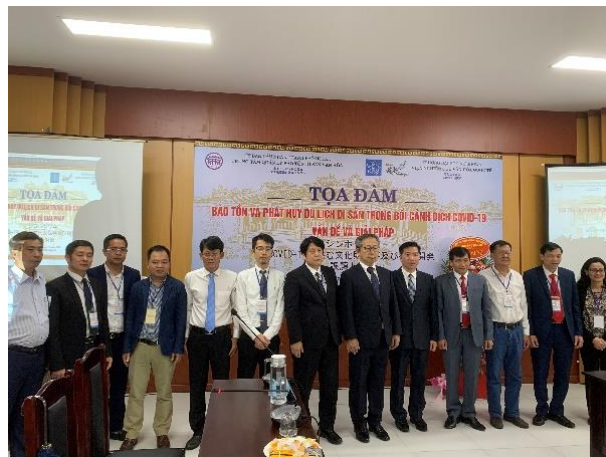
Các đại biểu chụp ảnh kỷ niệm

Tại buổi Tọa đàm, đại diện Ban quản lý Di tích làng cổ Đường Lâm và Sở Văn hóa, Thể thao và Du lịch Tiền Giang đã giới thiệu về các hoạt động nhằm tận dụng, phát huy hiệu quả các di sản văn hóa và nguồn tài nguyên du lịch hiện có, như tổ chức các lớp học nấu ăn và đặt các nhà hàng trong các ngôi nhà cổ, tổ chức các