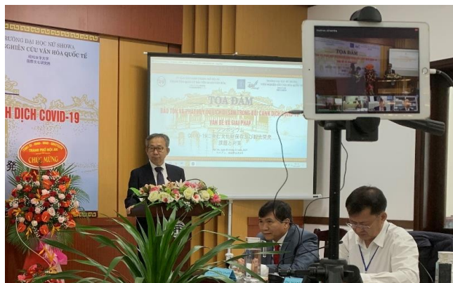
Ông Yamada Takio - Đại sứ Nhật Bản tại Việt Nam phát biểu khai mạc Tọa đàm

Bất chấp những khó khăn đó, ngành du lịch của ba địa điểm trên vẫn nỗ lực thực hiện các hoạt động phát triển sản phẩm và kích cầu du lịch hướng tới đối tượng khách du lịch trong nước. Người dân địa phương đã trồng hoa trên các tuyến đường du lịch, tạo ra các sản phẩm du lịch mới, tham gia các chương trình đào tạo hướng dẫn viên nhằm chuẩn bị đón sự trở lại của du khách trong thời gian sớm nhất./.