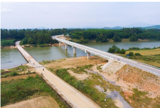
Cầu Dinh mới (cầu cao) được xây dựng trong khuôn khổ dự án tại tỉnh Nghệ An

Các dự án JICA đã và đang thực hiện tại Việt Nam từ năm 1992 đến nay phủ rộng nhiều lĩnh vực, từ y tế, giáo dục, nông nghiệp, năng lượng đến giao thông v.v... Hiện nay JICA đang thực hiện gần 100 dự án phát triển tại Việt Nam thuộc tất cả các lĩnh vực này./.