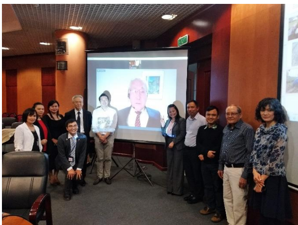
Các đại biểu chụp ảnh lưu niệm cuối Hội thảo

Cùng với việc đề xuất phải làm rõ những khó khăn về kinh tế, thu nhập cần thiết của người cao tuổi, chuyên gia từ Nhật Bản chia sẻ tình hình xã hội già hóa và những giải pháp để giải quyết các vấn đề về người cao tuổi tại Nhật Bản.