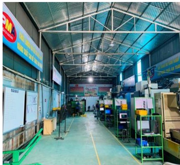
Nhà xưởng công ty PMA

Câu chuyện cơ hội việc làm của thực tập sinh về nước cũng là một vấn đề nhận được nhiều sự quan tâm của hai Chính phủ Việt Nam – Nhật Bản. Hiện có khoảng 200.000 thực tập sinh Việt Nam đang làm việc tại Nhật. Mặc dù hiện đã có kỳ thi năng lực tiếng Nhật để kiểm tra năng lực tiếng Nhật, nhưng hai nước cũng cần có một cơ chế kiểm chứng hoặc chấp nhận bằng cấp khách quan tại Việt Nam cho các kỹ năng kỹ thuật mà thực tập sinh đã học tại Nhật Bản. Thực tập sinh kỹ năng vốn không có bằng cấp học vấn cao và cũng khó tìm được công việc mong muốn khi về nước nên việc học tập đạt bằng cấp và đào tạo lại kỹ năng thông qua đào tạo từ xa là rất cần thiết. Nhật Bản đang xem xét dành nguồn ODA để đóng góp vào phát triển nguồn nhân lực công nghiệp thông qua các hỗ trợ như thế về sau. Trong những năm gần đây, JICA đã và đang nỗ lực triển khai nhiều hoạt động phát triển nguồn nhân lực công nghiệp tại Việt Nam để mang lại lợi ích thiết thực cho thực tập sinh sau khi về nước.