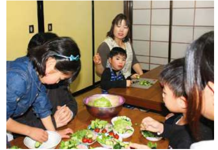
3歳から中学生までが通う『あおむし』では、料理などの生活スキルを覚えることで、人との関わり方やルールを身に付けていくという。

の子どもたち。同僚や子どもたちと3か月かけて完成させた壁画は地元新聞でも紹介され、地域の人たちに子どもたちの創作活動を見てもらえる場になり、養護学校のイメージアップにも役立った。「こうした活動を続けるためにも、自分たちで資金を稼ごうと考えました。雑誌のページを三つ折りにしてバスケットを作ったり、粘土で花瓶を作ったり……おかげで子どもたちの創作意欲もだんだん向上していったんです」