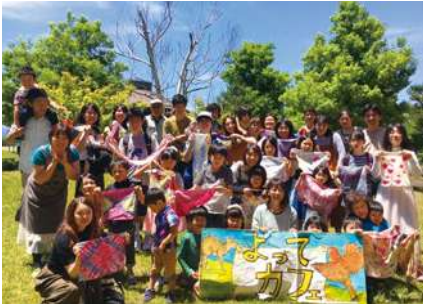
養護学校の卒業生のために開設した『よってカフェ』。今では、障害や問題の有無を超えて地域の老若男女が集まる場になっている。