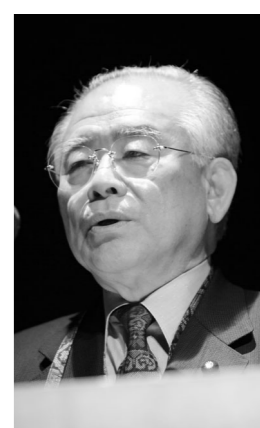
経済産業副大臣 松下 忠洋

昨年、モンゴルの大統領が来日し、国連での演説で「目覚まし時計が鳴って目覚まし、目を覚ましてください。いつまで寝ておられるのですか。起き上がって行動してください」と我々に語りかけました。イラクの首相からも「戦後復興に向け皆さんの力を