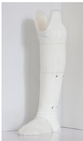
完全3Dプリントの義足