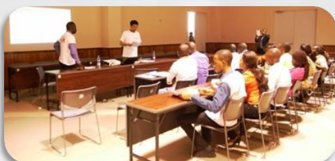
Renforcement des Capacités des conseillers

■ Une formation sur l'appui à l'emploi et à l'entrepreneuriat a été organisée au Japon en Septembre 2015. Sur base des connaissances acquises au travers de cette formation, nous avons élaboré plusieurs outils pour favoriser le placement dans l'emploi des stagiaires entre autres le modèle de CV, modèle de lettre de motivation. Faisant suite à ces activités, le renforcement des capacités des Conseillers a déjà commencé.