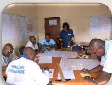
Collaboration avec un autre projet de coopération technique de la JICA