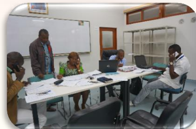
l'étude préliminaire de Sept. à Nov. 2015

■ Dans le cadre de l'étude préliminaire , une enquête téléphonique à l'intention des anciens stagiaires a été menée et a porté sur 4,600 anciens stagiaires sans-emploi de 2014 et 2,000 anciens stagiaires sans-emploi formés au 1 er semestre de 2015. L'enquête a été menée de Septembre à Novembre 2015 pour s'enquérir de la situation des stagiaires après leur formation à la Dipro-Kin/INPP.