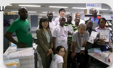
Formation au Japon

■ En plus de l'appui à l'emploi, nous sommes dans une tentative de vulgariser l'esprit entrepreneurial au sein de l'INPP. A l'issue de cette première action, nous réaliserons chaque activité en tenant compte du plan d'action. Nous sommes à l'étape de préparation du module de formation entrepreneuriale à être incorporer dans chaque filière de formation de stagiaires sans-emplois.