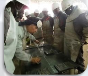
Formations pour MFs en Soudages Spécialisés (ci-dessus) et H&P (ci-contre)