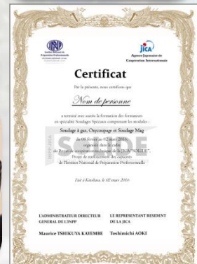
Modèle de Certificat