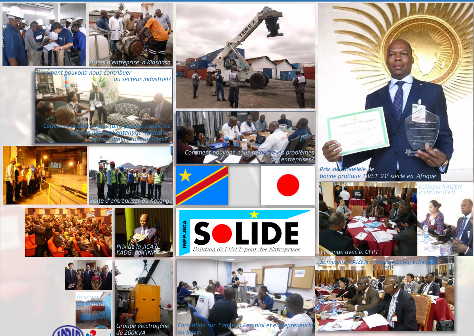
Visites d'entreprise à Kinshasa