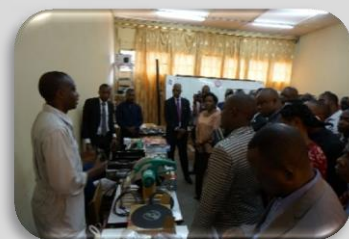
Remise officielle des équipements en mars 2016